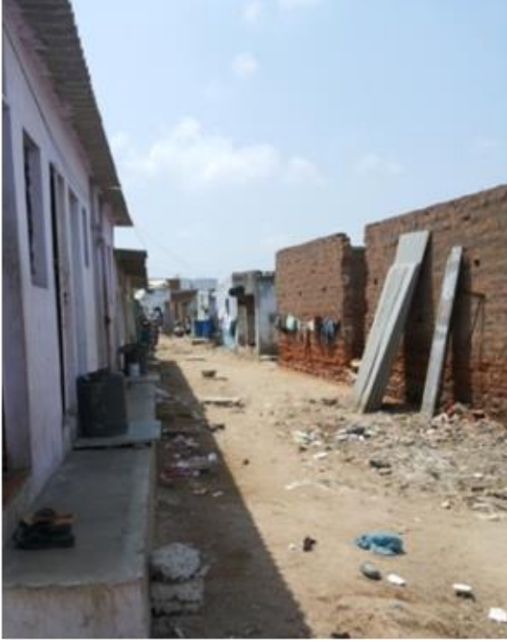
અર્ધ બંધાયેલ મકાનોનો ઉપયોગ અનૌપચારિક પ્રવૃત્તિઓ માટે

બંધાયેલ વાતાવરણનો સીધો પ્રભાવ અપરાધ અને હિંસા પર પડે છે. મૂળભૂત સેવાઓની ગેરહાજરીને કારણે બોમ્બે હોટલમાં બંધાયેલ વાતાવરણ સાવ કથળી ગયું છે. તેની થોડીઘણી ખુલ્લી જગાઓ અને તળાવો કચરાથી ખડકાયેલાં છે. ઘન કચરાના વ્યવસ્થાપનની જોગવાઈ બાબતે અ.મ્યુ.કો.ની બેદરકારીના પરિણામે આમ થયેલું છે. રહીશો આવી જગાઓએ જવાનું ટાળે છે. પછી તે દારૂ અને નશાના બંધાણીઓ માટે મિલનસ્થાન બની જાય છે.