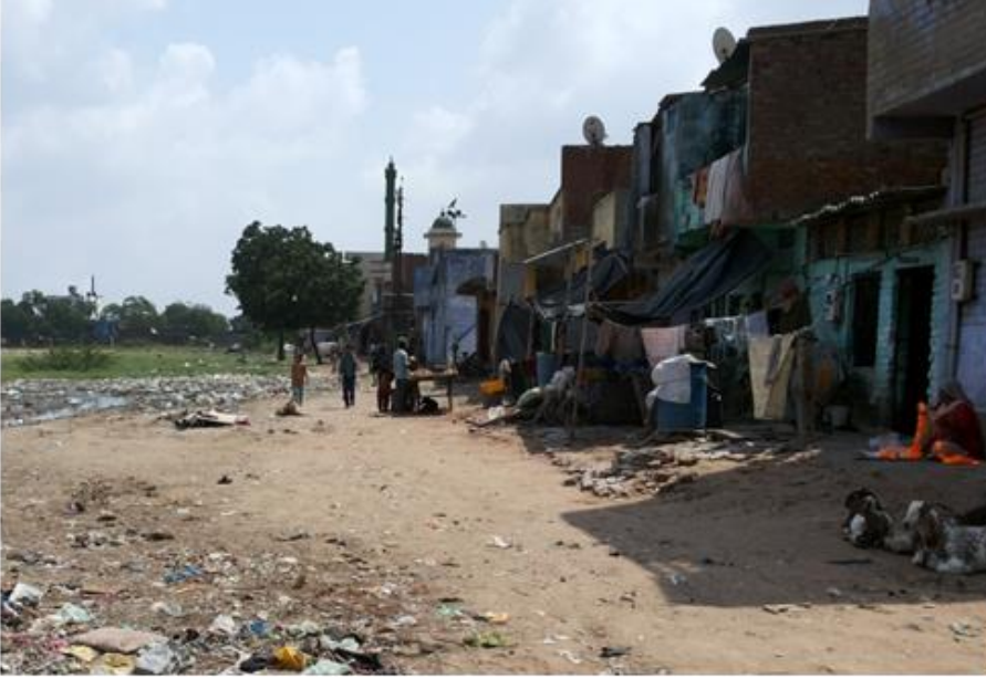
બોમ્બે હોટેલ વિસ્તાર માં બિલ્ડરે બનાવેલી એક હાઉસિંગ સોસાયટી

આવી અસલામત સ્થિતિ પેદા થવા પાછળ અનેક પરિબલો છે. બાંધકામના યોગ્ય આયોજન તેમજ માળખાકીય સવલતો અને સેવાઓ બાબતે આ વિસ્તારમાં રાજ્યની ગેરહાજરી રહેલી છે. આ વિસ્તારમાં કેટલીક વ્યક્તિઓ અને