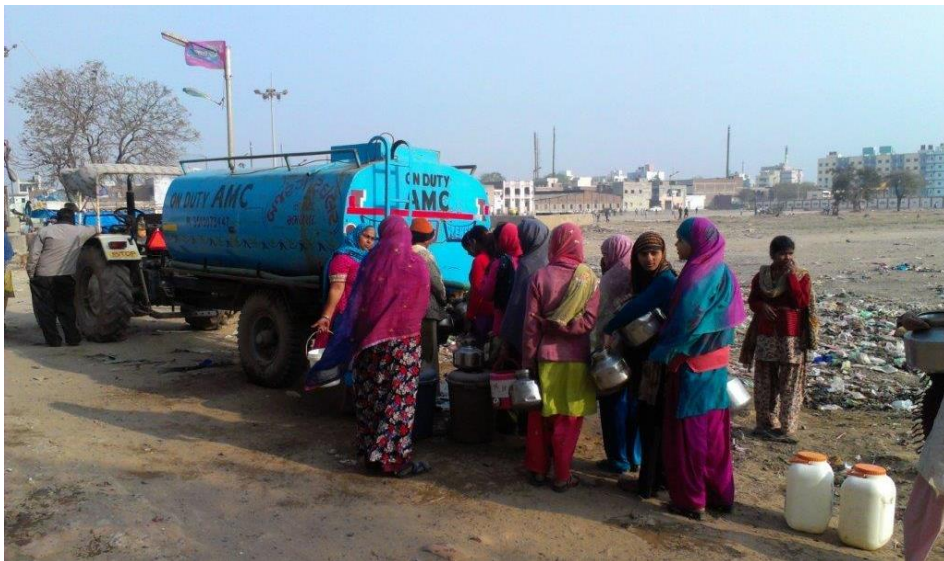
બોમ્બે હોટલના ફૈઝલ નગરમાં પાણીનું ટેન્કર આવતા લોકોની લાઈન લાગે છે

બોમ્બે હોટલ વિસ્તારમાં મૂળભૂત સેવાઓની જોગવાઈની અસમાનતા મ્યુનિસિપલ ટેન્કરો દ્વારા પહોંચાડવામાં આવતા પાણીના કિસ્સા પરથી પણ સમજી શકાય છે. પીવાનું પાણી મેળવવા માટે બોમ્બે હોટલના રહીશો અનહદ સંઘર્ષ કરી રહ્યા હતા. રાજકીય કાર્યકર્તાઓની મધ્યસ્થીને પરિણામે અ.મ્યુ.કો.એ અહીં પાણીનાં ટેન્કર પૂરાં પાડ્યાં. આમ છતાં, અત્યારે ટેન્કરો દ્વારા માત્ર ૩.૫ ટકા જેટલી વસ્તીને થઈ રહે એટલું જ પાણી પૂરું પાડવામાં આવે છે. પરિણામે, પાણી મેળવવા માટે રહીશો વચ્ચે આ મુદ્દે નવા તકરાર ઊભા થાય છે. ટેન્કરો અમુક જ વિસ્તારોમાં પાણી પૂરું પાડે છે. અન્ય વિસ્તારોમાં રહેતા લોકો પૂરતા પાણીના અભાવમાં જ જીવે છે. પરિણામે એમણે બોરવેલમાંથી મળતું દૂષિત પાણી પીને જ ગુજારો કરવો પડે છે. પાણીનાં ટેન્કરોમાંથી પાણી ભરવા માટે લોકોને લાઈનસર ઊભા રાખવાની જવાબદારી કેટલાક સ્થાનિક આગેવાનો લે છે. પરંતુ તેઓ પણ પોતાના તેમજ પોતાના મિત્રો અને સગાંસંબંધીઓ માટે વધારાનું પાણી સુરક્ષિત કરી રાખે છે.