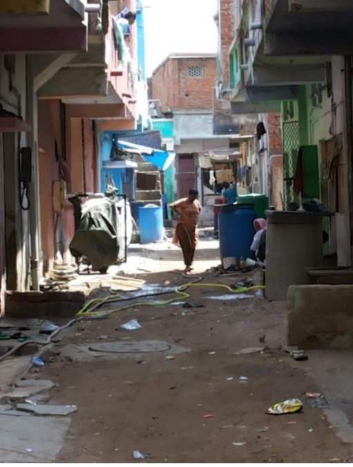
બોરવેલ દ્વારા પાણી દર આંતરે દિવસે ફક્ત ૧૫-૨૦ મિનિટ માટે જ આપવામાં આવે છે જે રહિશોની જરૂરીયાત પૂરતું નથી

મસ્જિદો એવો દાવો કરે છે કે પાણીના પુરવઠામાંથી મળતા નફાનો ઉપયોગ મસ્જિદના જતન અને જાળવણી માટે કરવામાં આવે છે. આમ છતાં, એવા કિસ્સા બન્યા છે કે જેમાં મસ્જિદના કોઈ પદાધિકારીએ અપ્રમાણિકતા રીતે આ પૈસા લઈ લીધા છે.