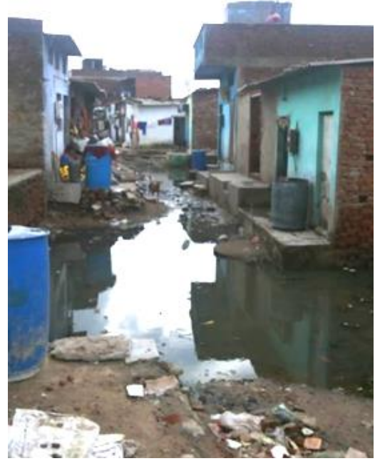
ચોમાસામાં અપૂર્ણ ગટરના લીધે આંતરિક રસ્તાઓ પાણીથી ભરાઈ જાય છે

અનૌપચારિક બિનરાજકીય લોકોએ ગટરની સુવિધા પૂરી પડવાના પૈસા લીધા છે પરંતુ એની જાળવણી પ્રત્યે કોઈ જવાબદારી લેતા નથી. ઉદાહરણ તરીકે, શરૂઆતમાં બિલરોએ ચાર-પાંચ પરિવારો વચ્ચે ગટર માટેના ખાળકૂવા બનાવીને આપ્યા હતા. બિલરોએ એની લાંબા સમયની જાળવણી પર ધ્યાન ન આપ્યું અને એ ખાળકૂવાઓને આસપાસના ઉદ્યોગોની ગટરની લાઈનો સાથે ગેરકાનૂની રીતે જોડી દીધા. પરિણામે, વધતી જતી વસ્તીની સામે ગટરો અને ખાળકૂવાઓની માત્રા ઓછી થવાને કારણે તે વારંવાર ઊભરાઈ જતી. એને કારણે અહીંનું વાતાવરણ દૂષિત થવા લાગ્યું.