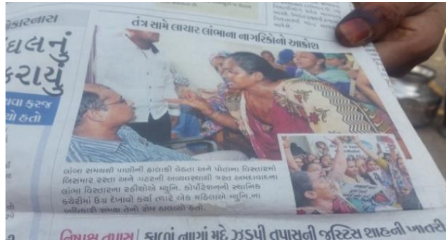
બોમ્બે હોટલના રહીશો દ્વારા પ્રાથમિક જરૂરીયાતોની અછત સામે વિરોધ (દિવ્ય ભાસ્કર, મે ૨૬, ૨૦૧૪)

ઉપેક્ષિત નાગરિકો હોવા છતાં કેટલાક રહીશો સતત અને અથાગ પ્રયત્નો દ્વારા સ્થાનિક મ્યુનિસિપલ અધિકારીઓ સાથે સારા સંબંધો કેળવી શક્યા છે. આ સંબંધો કેળવવામાં અનહદ સમય અને પ્રયત્નો લગાવવામાં આવ્યા છે. ઊપરાંત, સ્થાનિક આગેવાનોએ પણ આમ કરવામાં અનેકવાર નોંધપાત્ર રીતે નાણાં પણ રોક્યા છે. ૨૦૧૫ના મ્યુનિસિપલ ઇલેક્શન માટે વોર્ડના સીમાંકનની અપેક્ષિત પુનર્ચનાને કારણે લાંબામાં આવતી અનેક સોસાયટી હવે બહેરામપૂરામાં આવે છે. આ સોસાયટીના સ્થાનિક આગેવાનો આનાથી પરેશાન હતા કારણ કે, લાંબા વોર્ડના અધિકારીઓ સાથેના એમના કેળવેલા સંબંધો હવે નાદુરસ્ત થઈ ગયા છે જેનાથી સવલતો મેળવવી વધુ મુશ્કેલ બની છે.